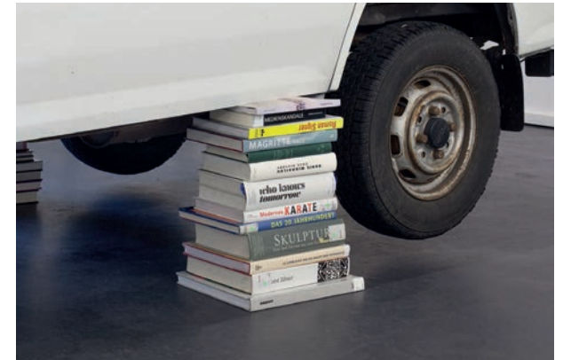
Hijet (Detail), 2016 Installationsansicht Kunsthaus Rhenania, Köln