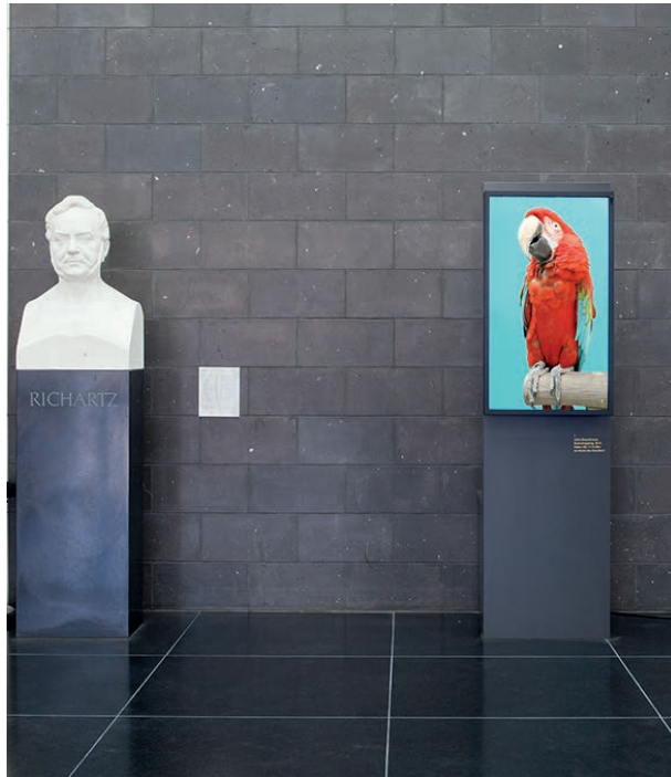
Namedropping, 2014 Installationsansicht Wallraff-Richartz-Museum, Köln